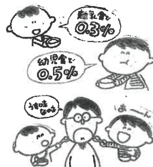
「Q&A子どもの心身の発達と食事」(めばえ社) 参考

薄味といえる食塩量は、離乳食で0.3%、幼児食で0.5%です。大人がおいしいと感じる塩味は1%です。それと比べるととても薄いように感じますが、子どもは十分おいしく感じます。離乳期以降の食事体験によって、子どもの塩味に対する嗜好が形成されていきますから、この時期から薄味に配慮しましょう。