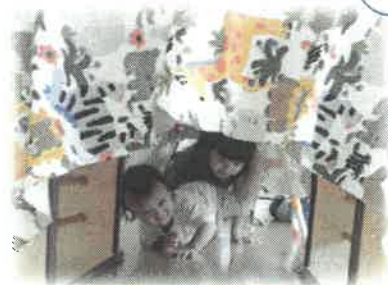
トンネルたのしい～♪